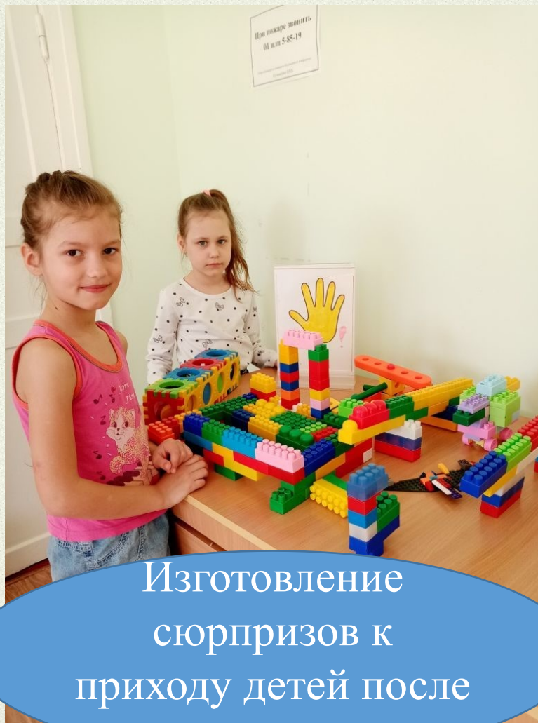
Изготовление сюрпризов к приходу детей после отсутствия

Приёмы используемые в работе с детьми для положительного эмоционального комфорта детей